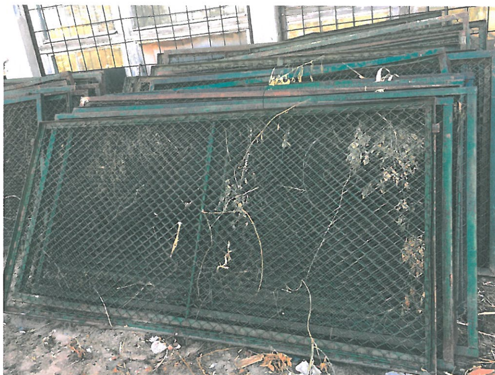
Część II ogrodzenie metalowe z płaskownika